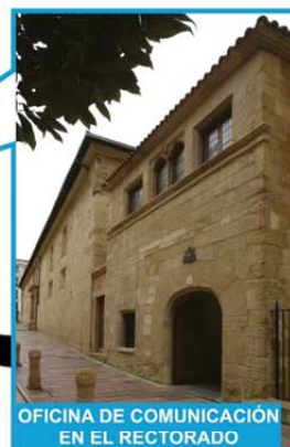
OFICINA DE COMUNICACIÓN EN EL RECTORADO