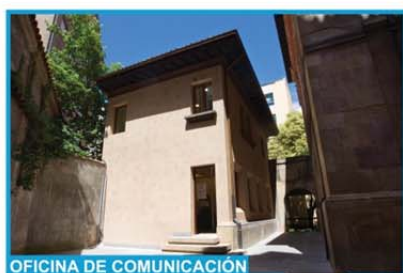
OFICINA DE COMUNICACIÓN